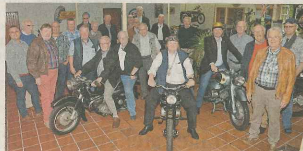
Das Motorradmuseum in Ibbenbüren war Ziel der Königsausfahrt der Bürgerschützen Lengerich 1810.